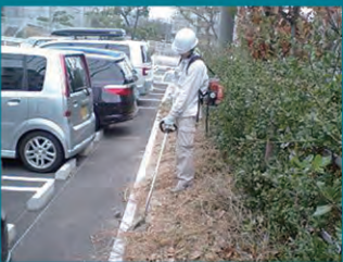
駐車場や人のいる公園