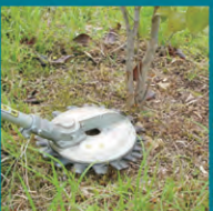
植込み・苗木のキワ