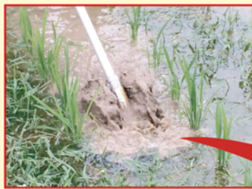
縦回転ローターで土にしっかり食い込み雑草を根元から処理できます